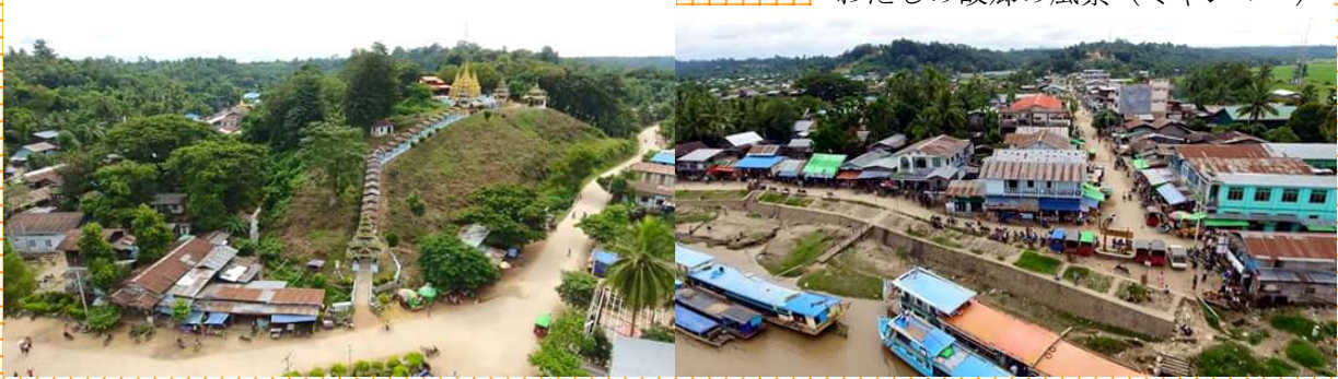
わたしの故郷の風景（ミャンマー）